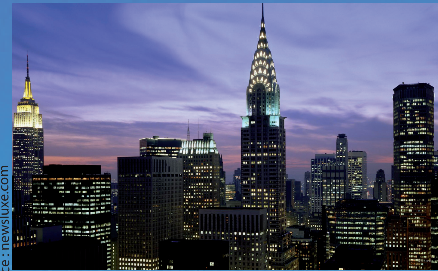
CBD de Manhattan : la plus célèbre des skylines

Si la conquête de la hauteur est surtout symbolique, est-ce sa seule finalité?