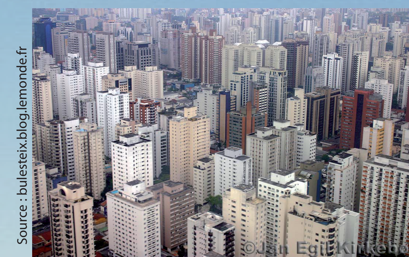
São Paulo : une densité à l'extrême.

Si la conquête de la hauteur est surtout symbolique, est-ce sa seule finalité?