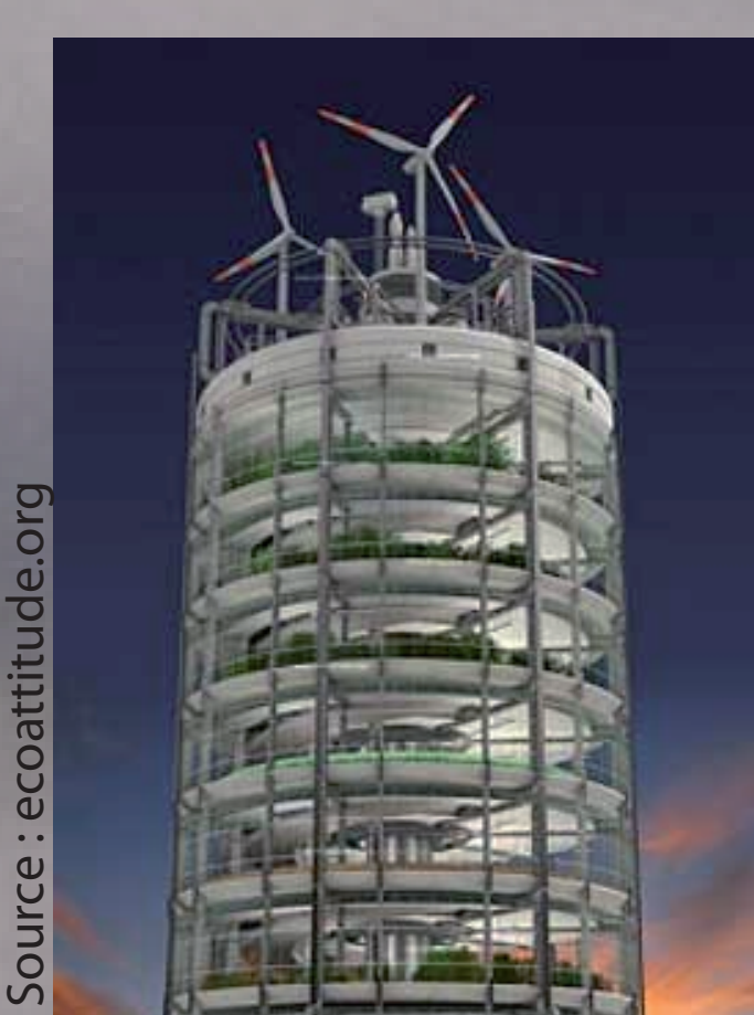
Nouveau concept d'agriculture urbaine : la ferme verticale.