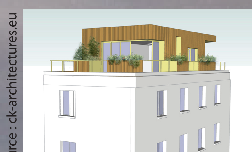
Surélévation : habitat construit sur des immeubles déjà existants.