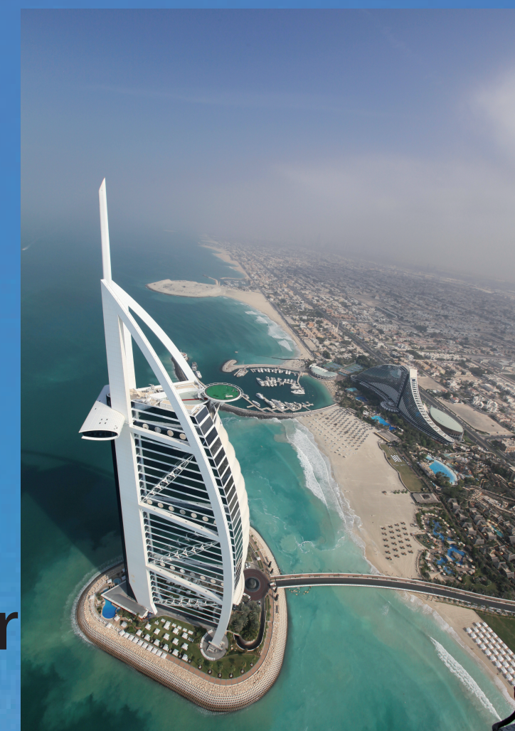
Hôtel burj al arab à Dubai

Le logo de l'entreprise transamerica est la tour du siège social.