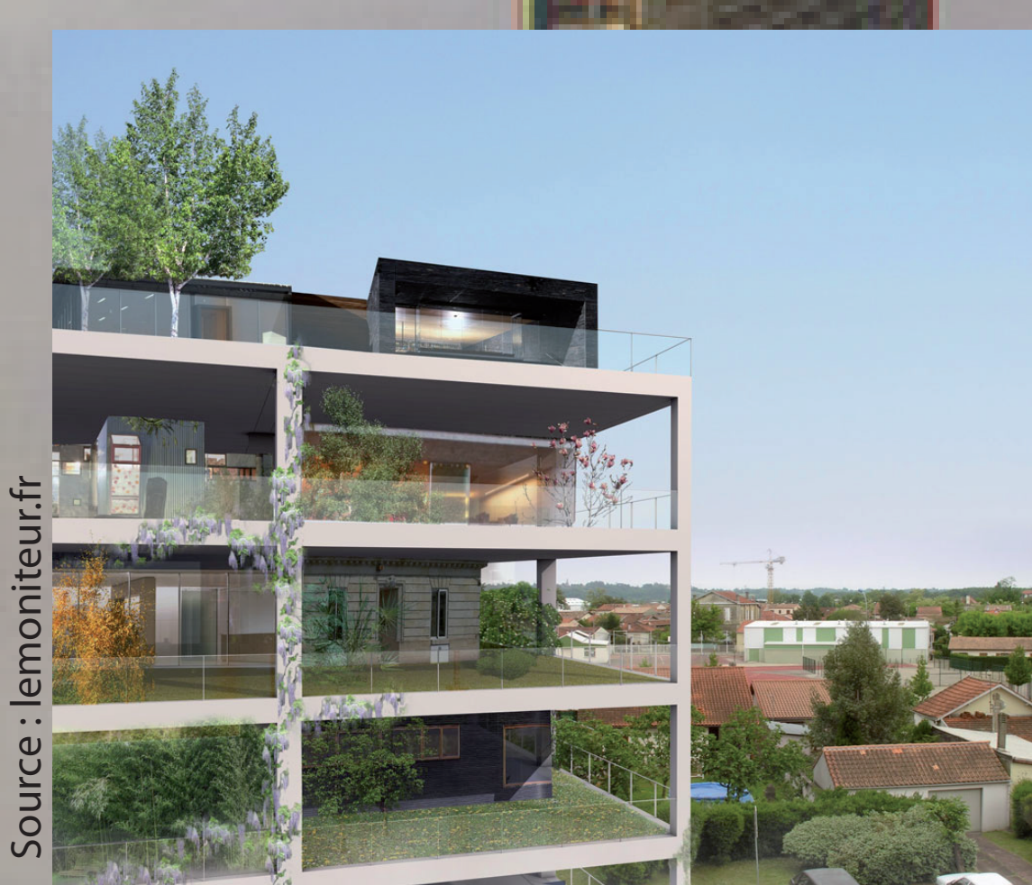
A Bègles premier lotissement vertical de France.

• Ferme verticale : réponse au problème du foncier.